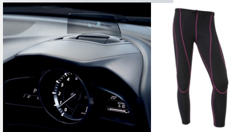
認証製品例 (※左上より時計回り。電気掃除機:パナソニック㈱、腰部サポートウェア「ラクニエ」:㈱モリタホールディングス、ウォーキングタイツ:ミズノ㈱、マツダアクセラ:マツダ㈱)